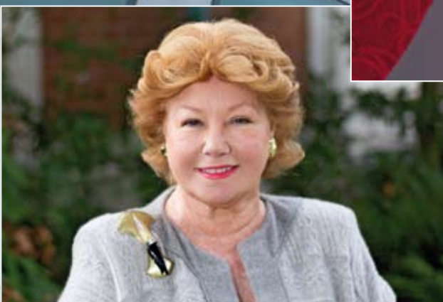
Nadine de Rothschild