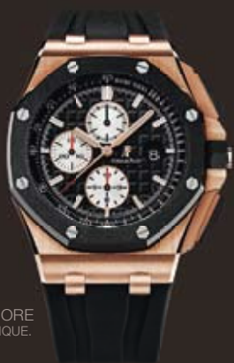
ROYAL OAK OFFSHORE EN OR ROSE ET CÉRAMIQUE. CHRONOGRAPHE.

MONTRE À L'ESTHÉTIQUE AUSSI PUISSANTE QU'AFFIRMÉE, LA ROYAL OAK OFFSHORE DISPOSE DE FONCTIONNALITÉS QUI SONT AUTANT DE SIGNATURES D'UNE MONTRE ICÔNE. SON EMBLÉMATIQUE LUNETTE OCTOGONALE ET SES POUSSOIRS SONT RÉALISÉS EN CÉRAMIQUE HAUTE DENSITÉ, INRAYABLE ET SEPT FOIS PLUS DURE QUE L'ACIER.